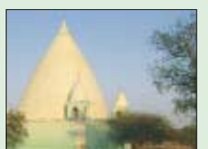
اليحوقباب ..... 9