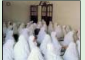
من رقائق الصوفية ..... 4