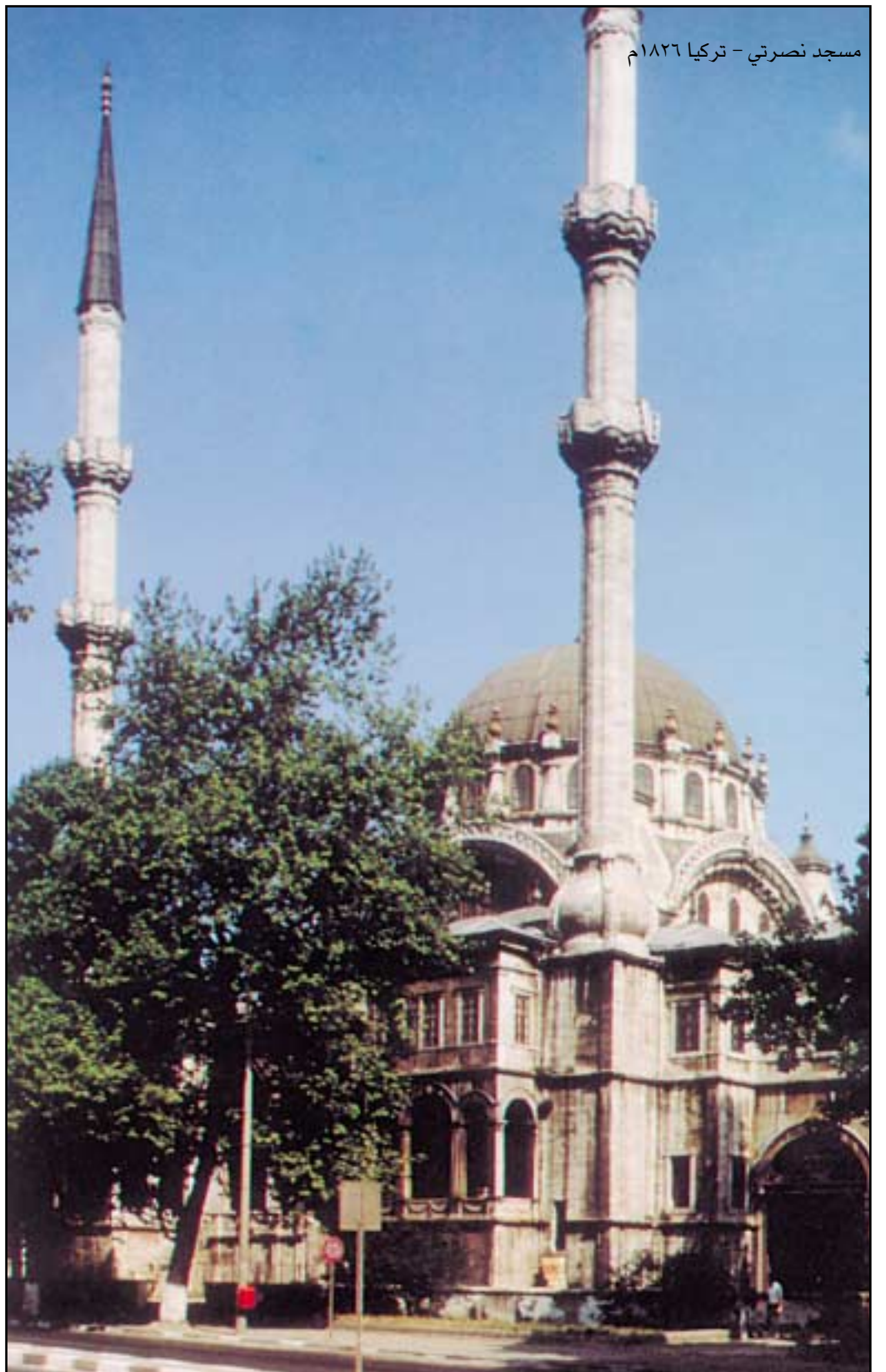
مسجد نصرتي - تركيا ١٨٢٦ م