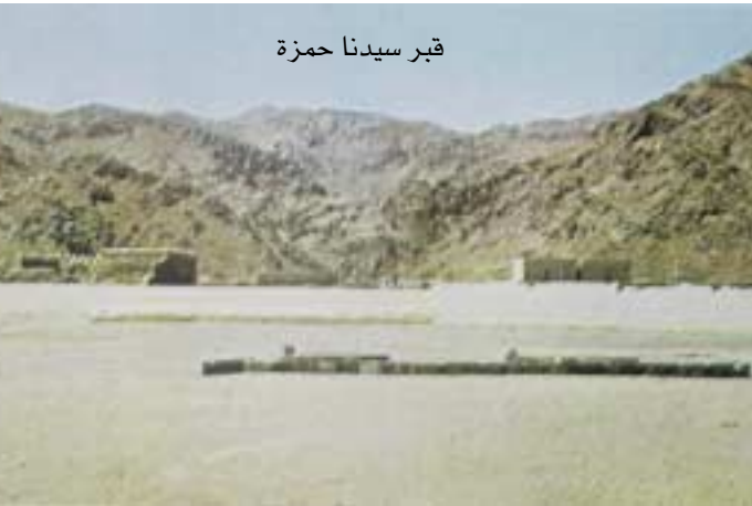
قبر سيدنا حمزة

ثلاثين ركباً من المهاجرين ليأخذ الطريق على أبي جهل بن هشام وكان في ثلاثمائة راكب من أهل مكة. وعقد له أيضاً اللواء في غزوة بني قينقاع (من اليهود) . ولسيدنا حمزة رضي الله عنه في غزوة بدر مقام مشهور وجهاد مشكور فقد كان قتلى المشركين فيها سبعين حيث انقرد سيدنا حمزة بقتل خمسة من رؤوسهم وشارك في قتل منهم وقد اضر رفح شأنه وأعلى شهد له المشركون بهذه مكانه فكان أعز شكيمة بن خلف المشرك في أثناءه - كما قال أمية بن خلف المشرك - أشدهم شكيمة القتال لعبد الرحمن بن العوف: يا عبد الإله من الرجل الأعظم بريشة النفرس محبة ومهابة. فكان صاحب نقص يخرج له، ثم يرجع من قصه فيطوف الكعبة قبل ذلك حمزة بن عبد المطلب. قال أمية: ذلك الذي فعل بنا الأفاعيل.