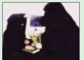
الزار ..... 7.6