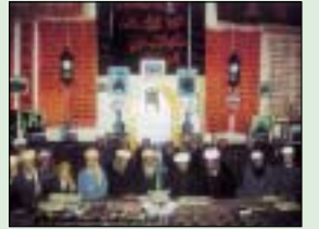
فضيلة العلم ..... 2