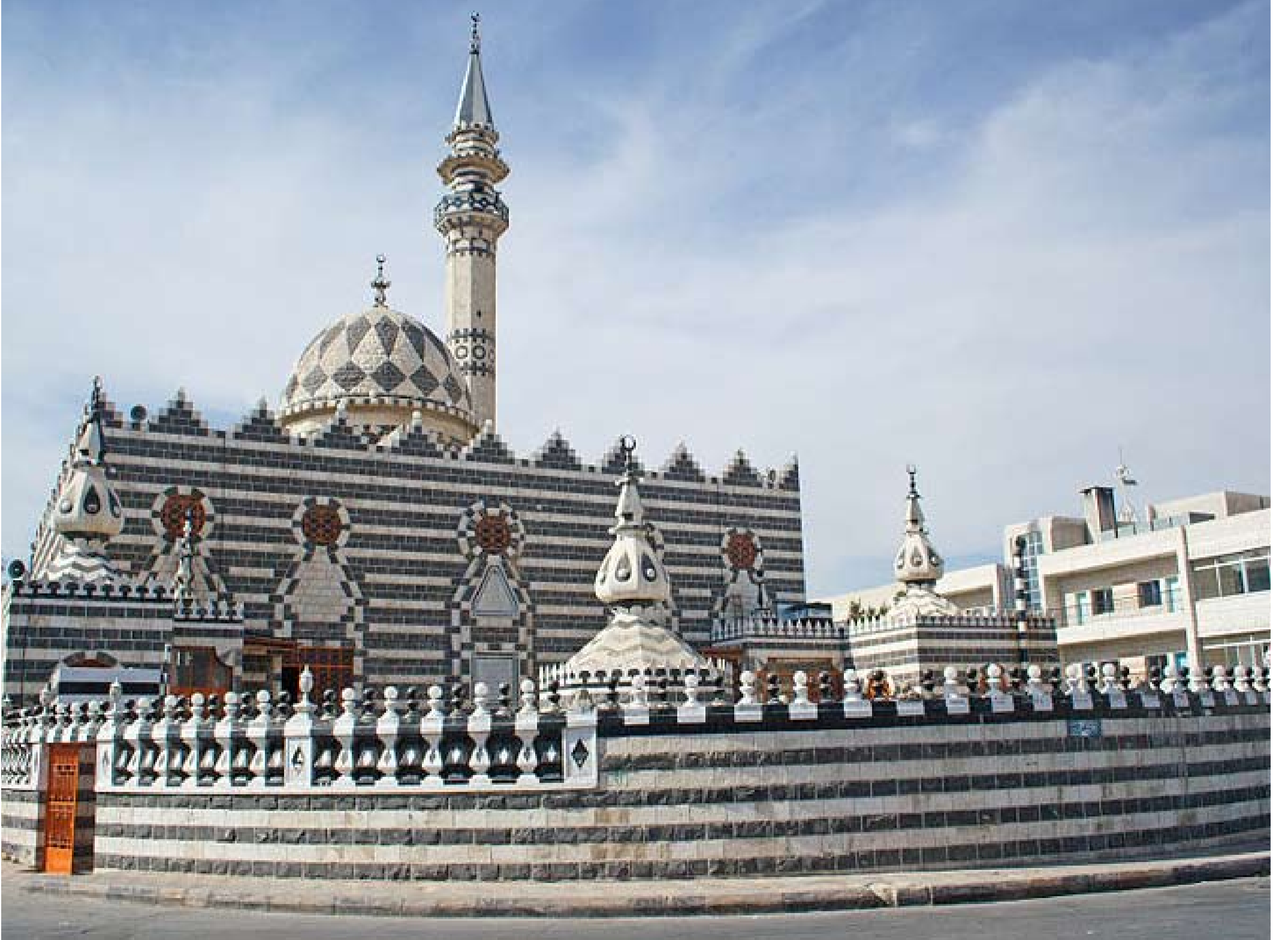
مسجد ابو درويش الاردن