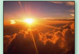
السيدة مريم سيدة النساء ..... 10