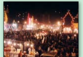
تعظيم المناسبات ..... 2