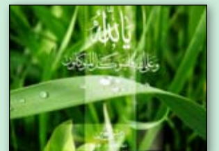
وحياة النبي ..... 7-6