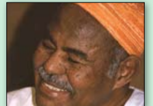
من نحب وترضى ..... 9